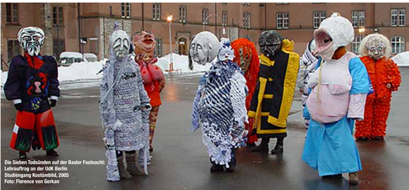
Die Sieben Todsünden auf der Basler Fastnacht: Lehrauftrag an der UdK Berlin Studiengang Kostümbild, 2005

Empathie und Wohlwollen ist wichtig in der Zusammenarbeit mit künstlerisch und handwerklich tätige Menschen. Dies setzt voraus, dass ich mich in diesen künstlerischen Arbeitszusammenhängen selber verstehe und meine künstlerische Intension vermitteln kann.