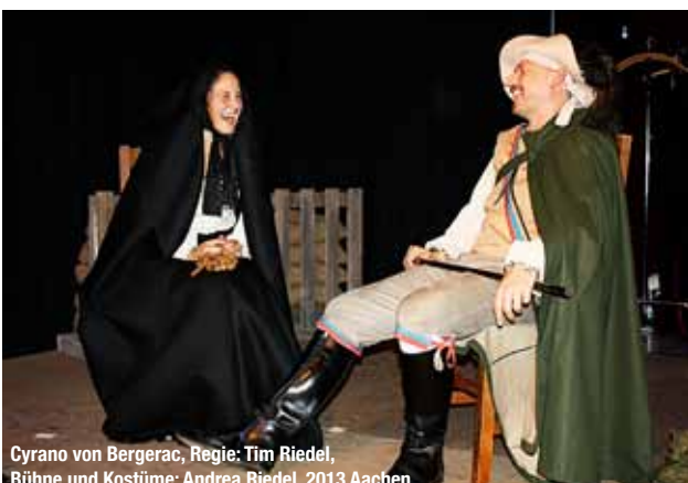
Cyrano von Bergerac, Regie: Tim Riedel, Bühne und Kostüme: Andrea Riedel, 2013 Aachen