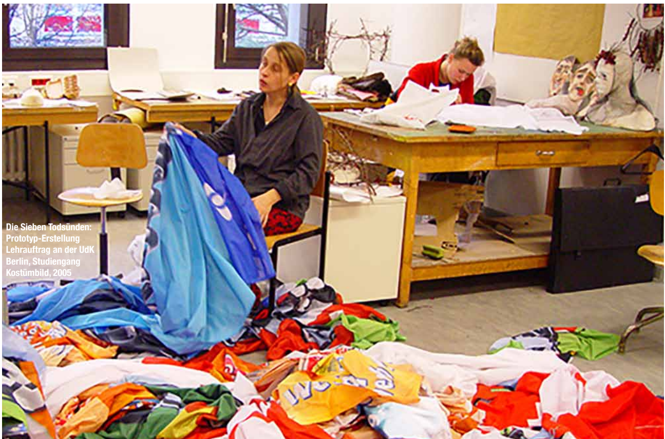
Die Sieben Todsünden: Prototyp-Erstellung Lehrauftrag an der UdK Berlin, Studiengang Kostümbild, 2005

Nur in der Zusammenarbeit und in der Bereitschaft, sich auf diesen Prozess einzulassen.